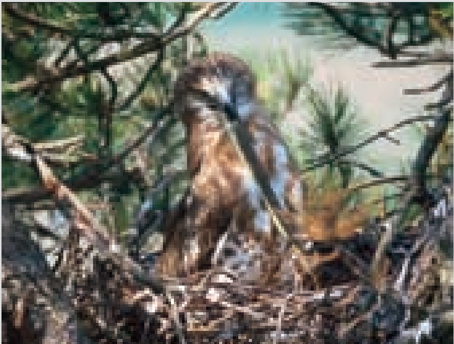
Sopra: adulto che ha portato al giovane una preda inusuale: un Ramarro. Sotto: Biancone che ingoia un Biacco, sicuramente è la preda più comune.