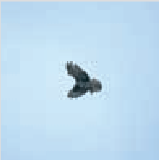
A fianco: Biancone in caccia con volo a "Spirito Santo".