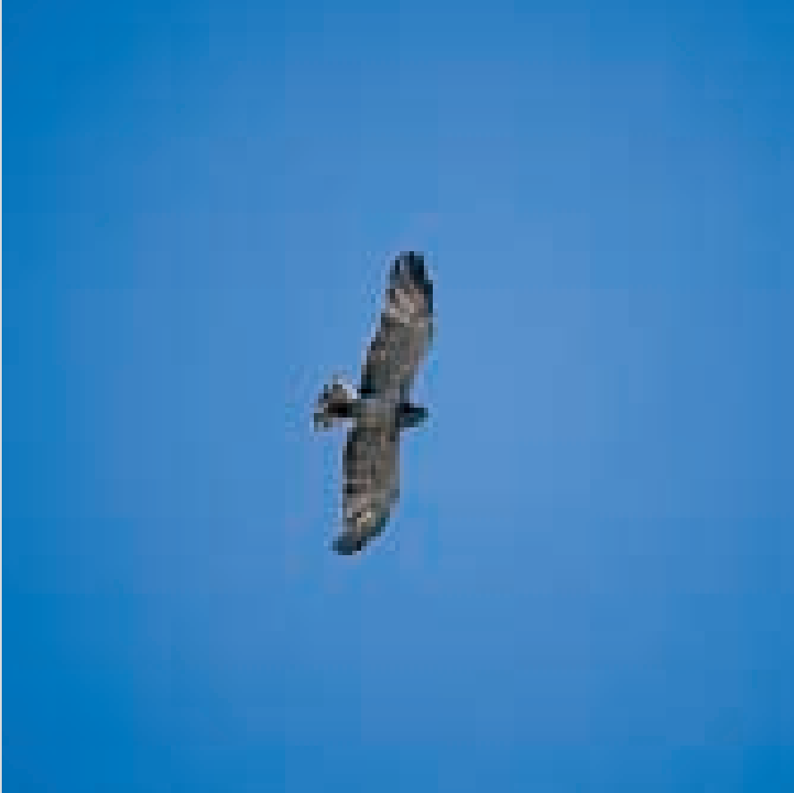
Sopra: Biancone in volo planato.