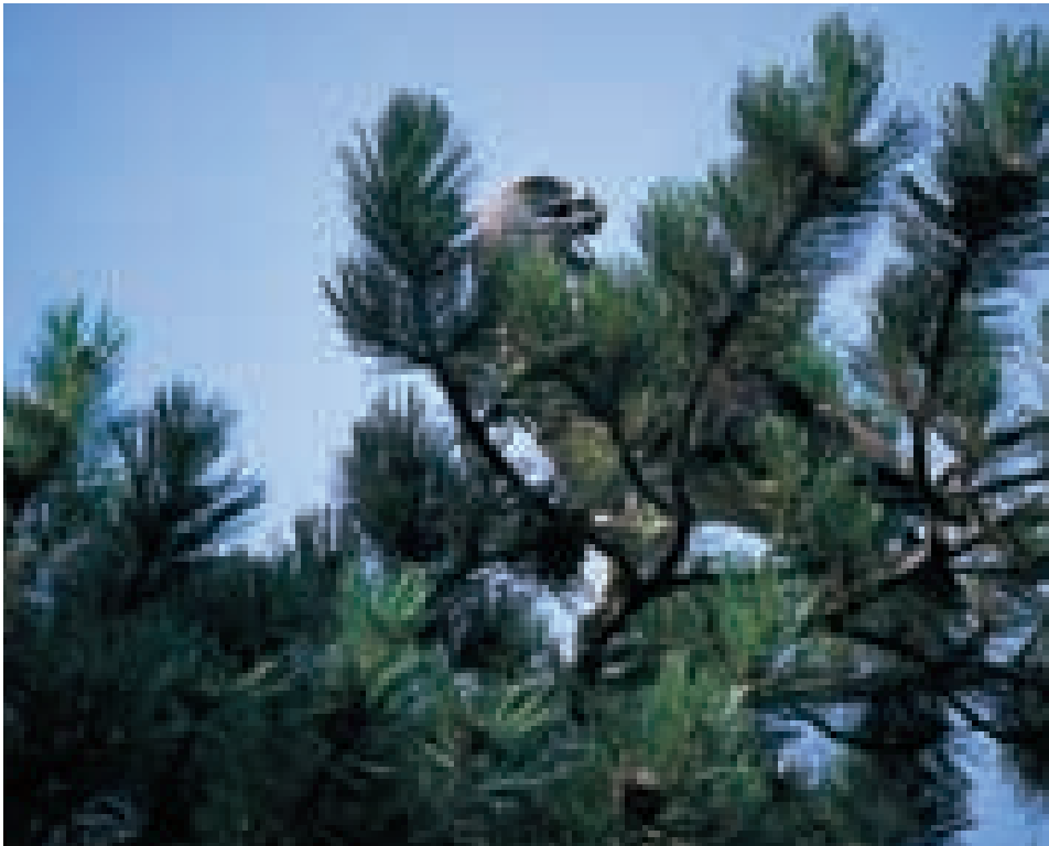
Femmina adulta con serpente che gli fuoriesce dal becco.

Le prede vengono portate al nido normalmente dalle 8 alle 19,30 ma con maggior frequenza dalle 10 alle 13 (ora solare). Dagli inizi di luglio il giovane mangia in media 2 serpenti al giorno. In una stagione una famiglia di Bianconi dovrebbe predare oltre 700 rettili.