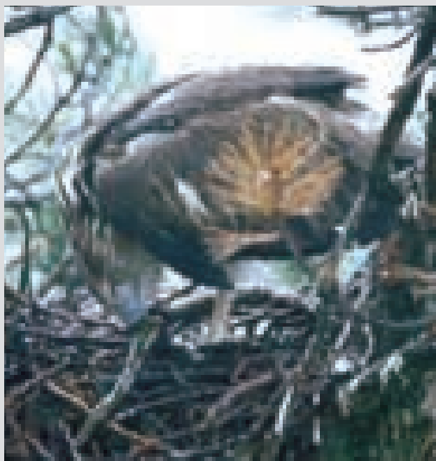
A fianco: prima di ingoiare i ser- penti il Biancone gli schiaccia la testa con il becco e a volte gliela stacca. Nella foto il gio- vane, sotto la pioggia battente è alle prese con una grossa vipera (il Biancone non è immune al suo veleno).