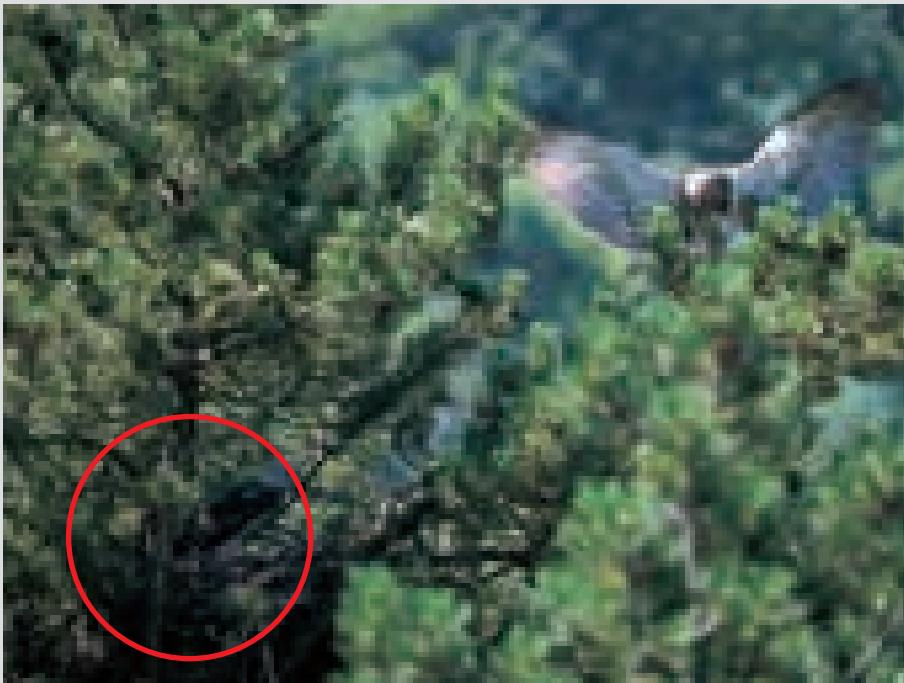
Sopra: giovane biancone al nido pronto all'involo mentre fa prove di volo. Sotto: adulto in arrivo al nido su pino nero.