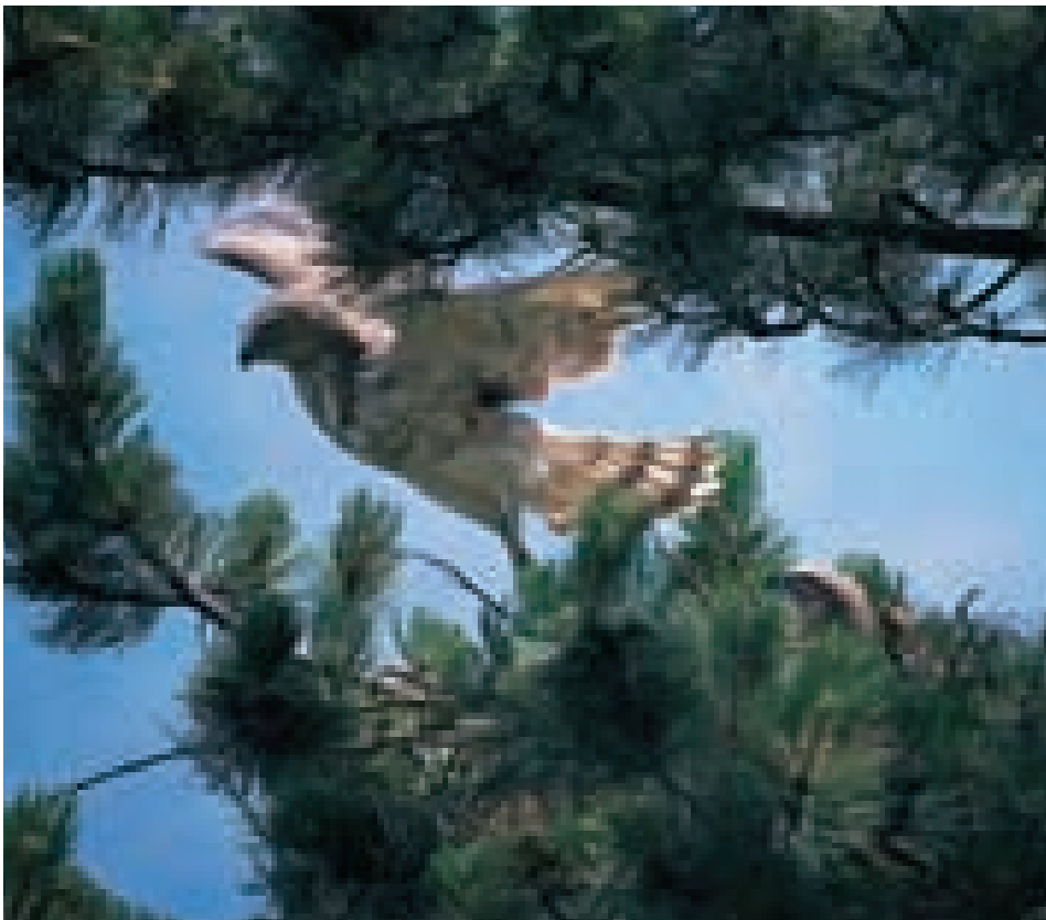
Femmina in partenza dopo aver lasciato un serpente al giovane.