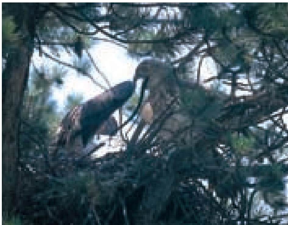
Biancone con giovane (nido del 1998)

Le notizie sull'alimentazione sono frutto di osservazioni personali di prede portate al piccolo o determinate dai resti trovati nel nido dopo l'involo del giovane. Le foto in prossimità del nido sono state scattate solo quando il giovane era già pronto all'involo, dopo aver trovato un nascondiglio sicuro e aver visto che la mia presenza passava del tutto inosservata.