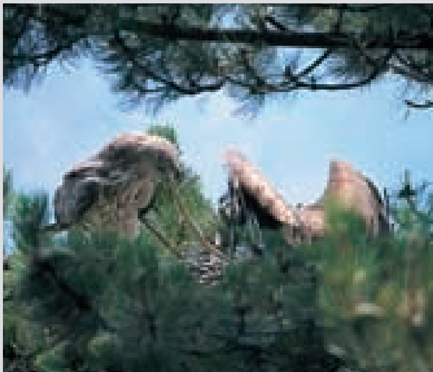
Sopra: 7/8/1999 - adulto che offre un Saettone al giovane.